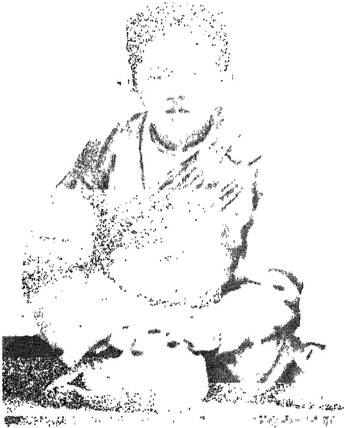
सुमित्रानंदन पंत (आयु १६ वर्ष)